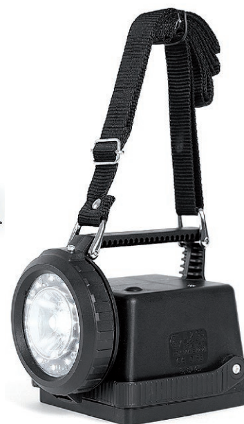
Correa bandolera Ref. CHR-1