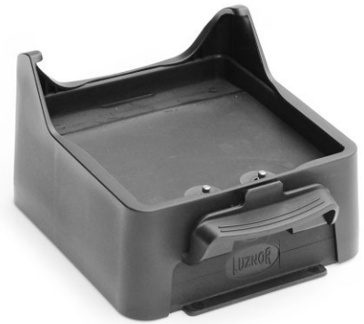
Cargador individual con sujeción mecánica: una pieza adicional impide el movimiento o desacople de la linterna mientras está en carga.